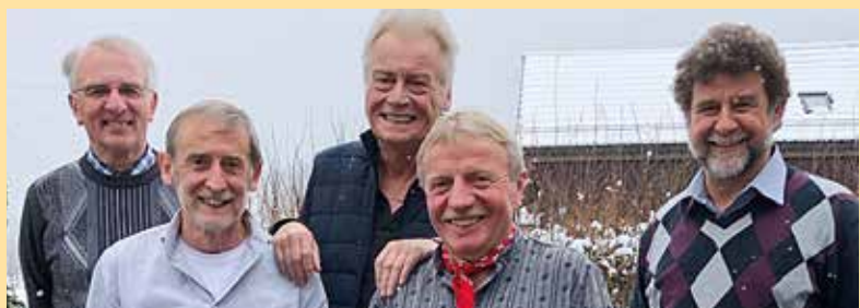
Fünf Wetter erprobte goldenen Konfirmanden fanden sich am kalten Palmsonntag zum wärmenden Erinnerungsaustausch und geselligen Zusammensein in Kirche und Gemeindesaal ein.